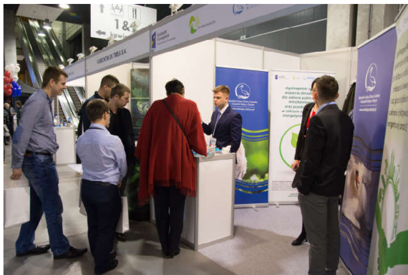
Targi Energy Expo Arena w Ostródzie

W dniach 29-30 listopada 2017 r. Fundusz uczestniczył w IV edycji targów Energy Expo Arena w Ostródzie, promując ogólnopolski system wsparcia doradczego dla sektora publicznego, mieszkaniowego oraz przedsiębiorstw w zakresie efektywności energetycznej oraz OZE.