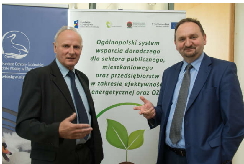
Konferencja "Dobre praktyki z wykorzystania pomp ciepła - technologie pomp ciepła"

Od 16 września 2017 r. Wojewódzki Fundusz prowadził kampanię reklamową na stronie internetowej i w mediach społecznościowych kolejnej edycji ogólnoeuropejskiej kampanii "Europejski Tydzień Zrównoważonego Transportu", której celem jest promowanie zrównoważonych środków transportu: komunikacji miejskiej, rowerów i ruchu pieszego. Zwieńczeniem akcji były obchody Europejskiego Dnia bez Samochodu. Głównym celem Europejskiego Tygodnia Zrównoważonego Transportu jest zwiększenie świadomości zagrożenia ekologicznego będącego wynikiem nadużywania samochodu jako indywidualnego środka transportu na terenie miast. Hasłem promocyjnym kampanii było: "Mobilność czysta, współdzielona i inteligentna", a jego głównym tematem dzielenie się mobilnością.