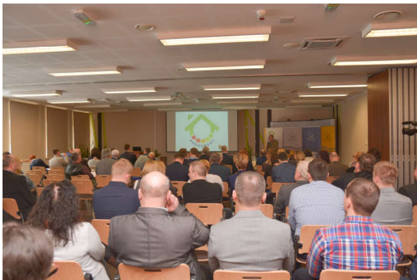
Konferencja "Program PROSUMENT na Warmii i Mazurach - co dalej"