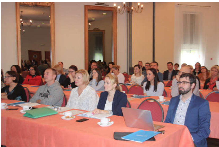
Szkolenie RPO WiM 2014-2020, 8-9 maja 2017

Szkolenia RPO WiM 2014-2020 odbyły się w terminach: 8-9 maja 2017 r. Łączna liczba uczestników szkoleń wyniosła 139 osób. Tematy szkoleń dotyczyły wszystkich działań wdrażanych przez Fundusz, tj.: 4.1 wspieranie wytwarzania i dystrybucji energii pochodzącej ze źródeł odnawialnych; 4.2 efektywność energetyczna i wykorzystanie OZE w MŚP; 5.1 gospodarka odpadowa; 5.2 gospodarka wodno-ściekowa; 5.3 ochrona różnorodności biologicznej, a w szczególności skupiły się na zagadnieniach: "Fundusze europejskie dla środowiska Warmii i Mazur - jak skutecznie złożyć wnioski na działania związane z ochroną środowiska i OZE" oraz „Jak przygotować wniosek o płatność i skutecznie rozliczyć projekt związany z ochroną środowiska i OZE”. Były to szkolenia specjalistyczne adresowane do beneficjentów i potencjalnych beneficjentów.