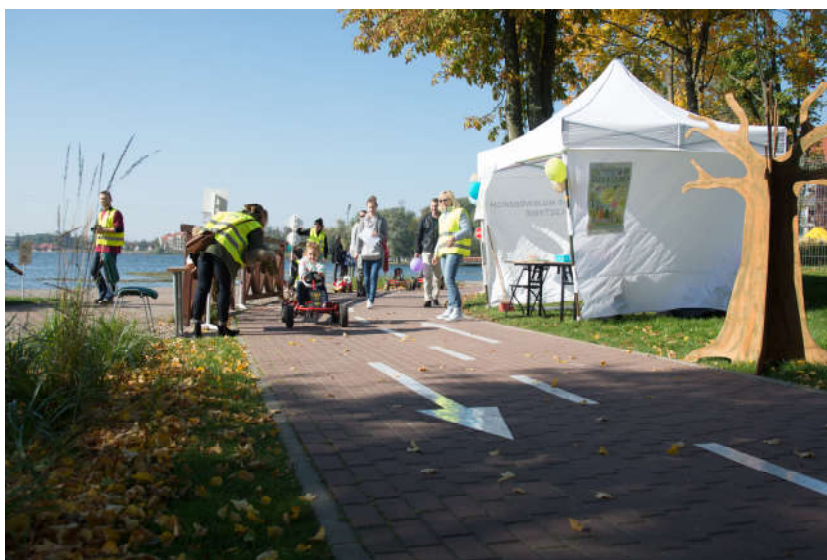
Festyn „Graj w zielone”

festynu była gra miejska z nagrodami dla dzieci, polegająca na przejściu uczestnika przez wszystkie stanowiska, prawidłowym wykonaniu zadań i zebraniu kompletu naklejek na karcie uczestnika. Na każdym ze stoisk poza grą miejską przygotowano również quizy, zagadki i inne zadania dla dzieci z drobnymi upominkami. WFOŚiGW w Olsztynie jako jeden z wystawców czynnie uczestniczył w tym wydarzeniu, przekazał również gadżety na nagrody dla dzieci biorących udział w festynie. Wydarzenie zakończyło się Zieloną Paradą. W grze miejskiej wzięło udział około 300 dzieci.