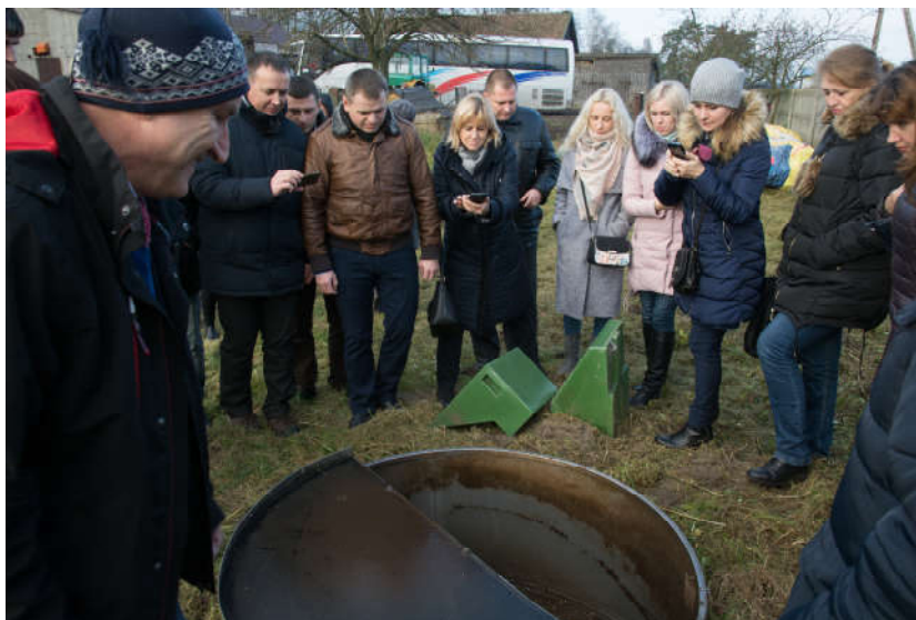
Szkolenie "Eurostandardy w ochronie środowiska" dla gości z Ukrainy

Szkolenie z zakresu gospodarki wodno-ściekowej "Eurostandardy w ochronie środowiska" odbyło się w terminie od 4-14 listopada 2017 r. , w którym uczestniczyło 30 przedstawicieli związanych z ochroną środowiska z Obwodu Równieńskiego na Ukrainie. Wojewódzki Fundusz współuczestniczył w wydarzeniu jako partner Fundacji Ochrony Wielkich Jezior Mazurskich oraz Narodowego Funduszu Ochrony Środowiska i Gospodarki Wodnej.