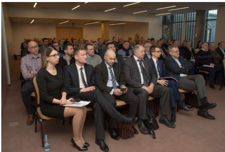
Konferencja "Fotowoltaika proces inwestycyjny krok po kroku"

W Olsztynie 10 stycznia 2017 r. odbyła się bezpłatna konferencja pt. "Fotowoltaika proces inwestycyjny krok po kroku". Była to próba odpowiedzi jak uchronić się przed ryzykiem związanym z powstaniem inwestycji wyposażonej w nieprawidłowo funkcjonujący system fotowoltaiczny. Konferencja finansowana była z projektu "Ogólnopolski system wsparcia doradczego dla sektora publicznego, mieszkaniowego oraz przedsiębiorstw w zakresie efektywności energetycznej oraz OZE" w ramach poddziałania 1.3.3. POLiŚ. Wzięło w niej udział 100 osób.