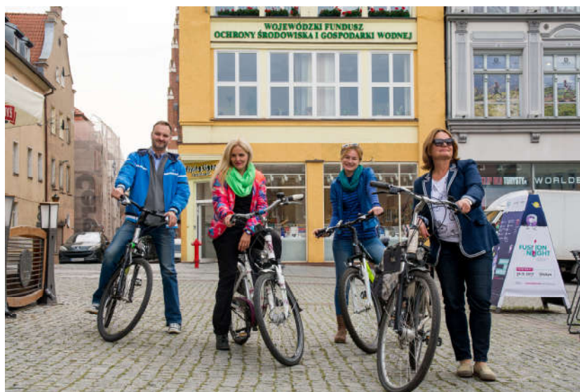
Kampania "Europejski Tydzień Zrównoważonego Transportu"

Od 16 września 2017 r. Wojewódzki Fundusz prowadził kampanię reklamową na stronie internetowej i w mediach społecznościowych kolejnej edycji ogólnoeuropejskiej kampanii "Europejski Tydzień Zrównoważonego Transportu", której celem jest promowanie zrównoważonych środków transportu: komunikacji miejskiej, rowerów i ruchu pieszego. Zwieńczeniem akcji były obchody Europejskiego Dnia bez Samochodu. Głównym celem Europejskiego Tygodnia Zrównoważonego Transportu jest zwiększenie świadomości zagrożenia ekologicznego będącego wynikiem nadużywania samochodu jako indywidualnego środka transportu na terenie miast. Hasłem promocyjnym kampanii było: "Mobilność czysta, współdzielona i inteligentna", a jego głównym tematem dzielenie się mobilnością.