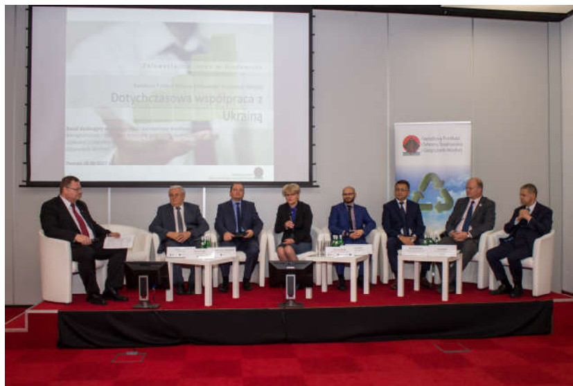
Targi Pol-Eco-System w Poznaniu

są rozwiązywane problemy związane z ochroną środowiska, ale też uczestniczyli w konferencji prasowej z udziałem Prezesa Narodowego Funduszu Ochrony Środowiska i Gospodarki Wodnej, dr Kazimierza Kujdy oraz licznych konferencjach branżowych. Pokłosem udziału w tym wydarzeniu były liczne i interesujące materiały emitowane w telewizji ukraińskiej, prasie i Internecie. Wojewódzki Fundusz uczestniczył także w tym samym czasie we wspólnym stoisku Funduszy, promując system finansowania ochrony środowiska w Polsce 17.funduszy.pl