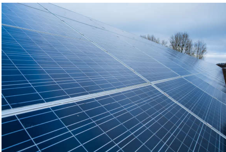
Instalacja fotowoltaiczna