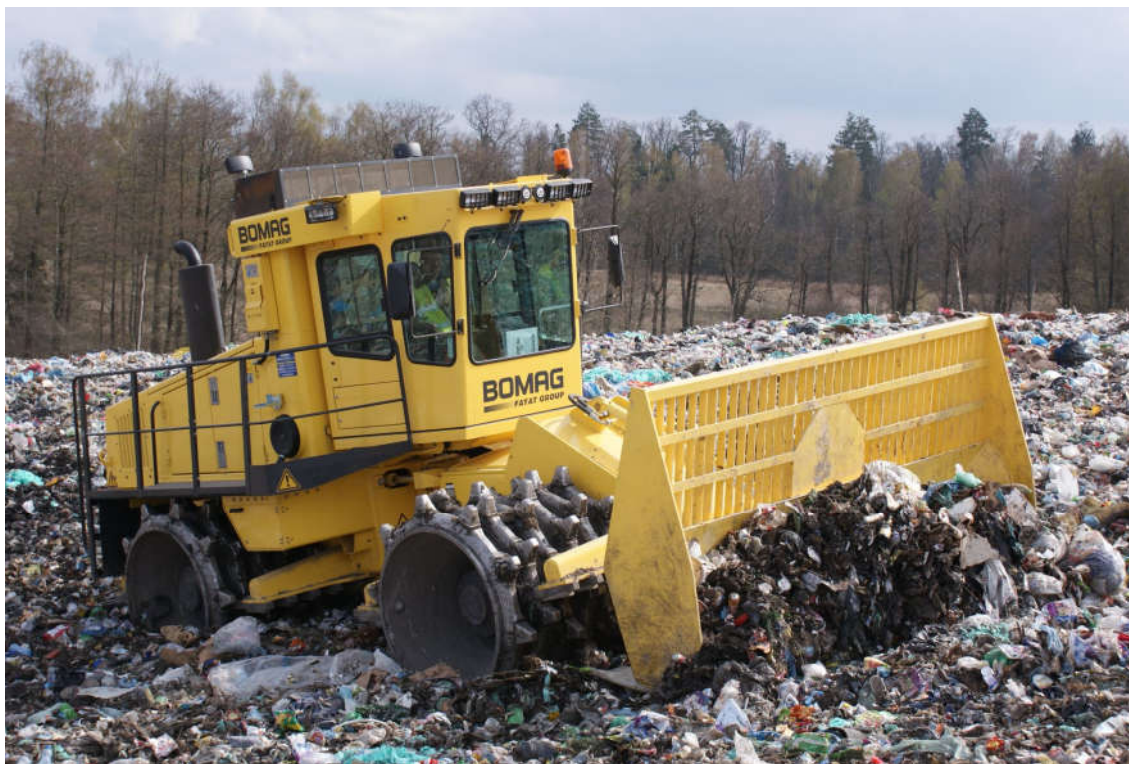
Kompaktor na składowisku odpadów w Wysiece k. Bartoszyca

W 2017 roku kontynuowano realizację programu "Usuwanie wyrobów zawierających azbest" na obszarze województwa warmińsko-mazurskiego. Program ten jest wdrażany od 7 lat we współpracy z NFOŚiGW. W 2017 roku na akcję usuwania azbestu w naszym regionie zdecydowały się 82 samorządy. Dzięki ich zaangażowaniu udało się usunąć ponad 6,5 tys. ton odpadów niebezpiecznych zawierających azbest z budynków należących do osób fizycznych, kościołów, związków wyznaniowych, wspólnot mieszkaniowych, spółdzielni mieszkaniowych, stowarzyszeń oraz obiektów jednostek sektora finansów publicznych. Koszt całkowity prac wyniósł 2 865 124,45 zł, a przekazane dofinansowanie z WFOŚiGW w Olsztynie - 1 117 512,26 zł oraz NFOŚiGW - 908 152,00 zł (49 umów finansowanych z NFOŚiGW). Dofinansowanie było udzielane na trzy działania: demontaż i zabezpieczenie pokrycia dachowego lub innych wyrobów zawierających azbest, transport odpadu niebezpiecznego z miejsca rozbiórki do miejsca unieszkodliwiania oraz unieszkodliwianie poprzez składowanie odpadu na składowiskach.