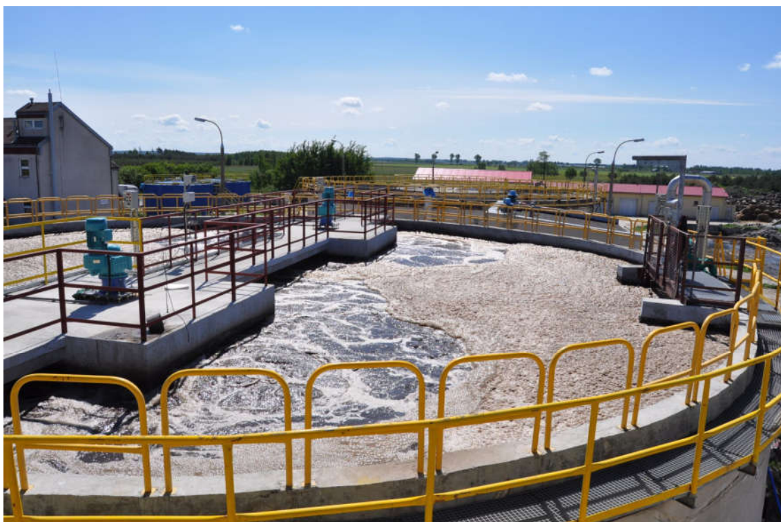
Oczyszczalnia ścieków w Pieszku- komora nityfikacji