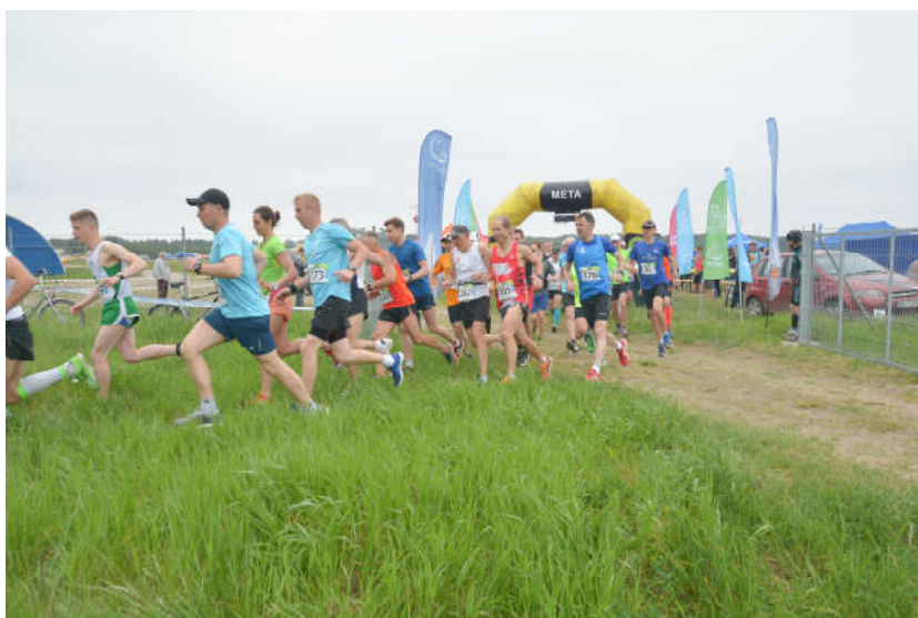
EkoStart Warmia i Mazury